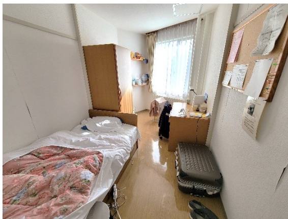
写真4 訓練生の個室

ここでの一日はなかなか過密である。朝7時の朝食に始まり、8時10分には全員が広場に集って点呼、連絡、国旗掲揚、ラジオ体操を行う。その後、午前から午後にかけて50分×5コマの語学授業をこなし、夕方には2時間の必修講座やオリエンテーションが組み込まれている。夜は17名前後の「生活班」ごとの点呼があり、23時に就寝となる。また、この時程の合間を縫って、自主講座や自学等が行われている。朝4時や5時に起きて自学や勉強会をする者、夜1時や2時まで自学する者もある。