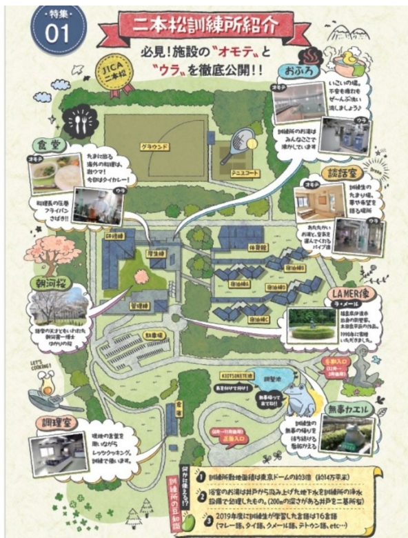
写真5 訓練所のマップ ( https://www.jica.go.jp/domestic/nihonmatsu/office/shisetsu.html )

訓練所の規律を守り、語学や講座への取り組みが疎かであれば、訓練中とはいえ余暇には自由が利き、多少羽目を外すことも容認されているように思われる。次第に恋話や即席カップルが、あちらこちらで芽生え始める。出会いを求め、刺激を求め、関係を育んでいく。訓練所は、そうした若者の青春装置、もしくは既に若者ではなくなった者の多世代型コミュニティとしても、機能している。