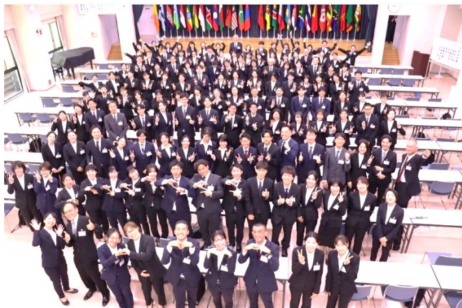
写真1 訓練生の集合写真

施設は、寮が併設された地方の公立大学を思わせる。近くの小さな町からも徒歩で30分ほど離れたその立地は、一種の「隔離された共同体」である。